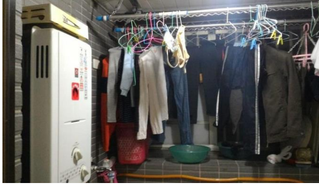
屋外式燃氣熱水器安裝於加蓋陽臺(錯誤安裝)